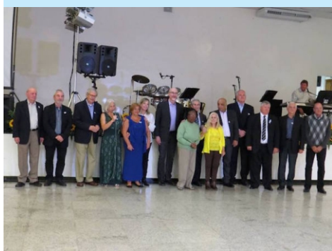
Jantar em comemoração aos 75 anos do Abrigo Bezerra de Menezes

Atualmente o IHF apoia 34 entidades sem fins lucrativos, entre elas a Associação Espírita Dr. Adolfo Bezerra de Menezes, através de assistência financeira, material, cultural e de prestação de serviços. Uma parceria de transparência e confiança que já completa 8 anos, onde o IHF teve uma grande atuação no fortalecimento de nossa instituição, passando pela criação do novo logotipo e site, consultoria de captação de recursos e o trabalho de equipe de voluntários juntos aos idosos acolhidos.