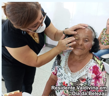
Residente Valdivina em "Dia da Beleza"

As unidades Penha e Itaquaquetuba agradecem doações e ações realizadas neste trimestre.