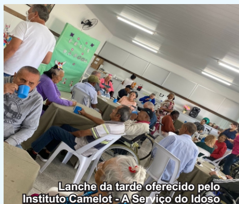
Lanche da tarde oferecido pelo Instituto Camelot - A Serviço do Idoso

Em 25 de março, recebemos a ação social do grupo Partilhar Social que, além de doações, ofereceu delicioso Lanche da Tarde aos acolhidos.