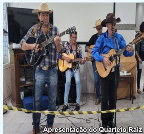
Apresentação do Quarteto Raiz