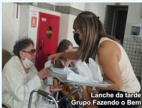
Lanche da tarde Grupo Fazendo o Bem

A ONG Presente de Alegria, no dia 16 de abril, também comemorou a Páscoa com os idosos, com sua alegre visita e distribuição de ovos.