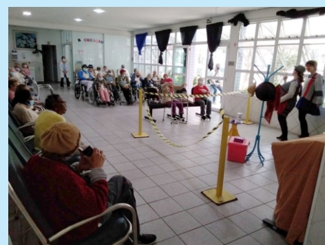
Apresentação teatral Grupo Lona de Retalhos