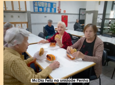
McDia Feliz na unidade Penha