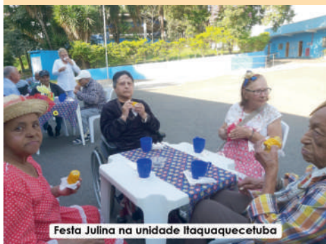
Festa Julina na unidade Itaquaquecetuba

A unidade de Itaquaquecetuba também recebeu uma linda festa “julina” em 27/07, dos amigos da Oficina Seadricar .