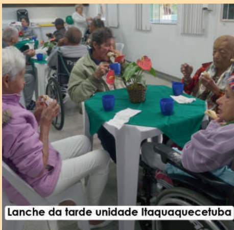
Lanche da tarde unidade Itaquaquecetuba