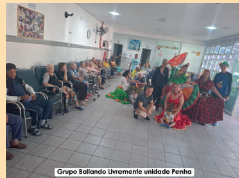
Grupo Bailando Livrementemente unidade Penha