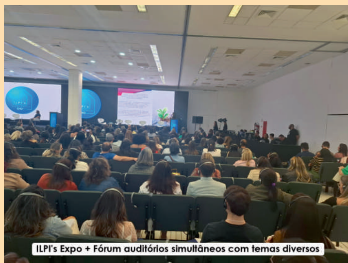
ILPI's Expo + Fórum auditórios simultâneos com temas diversos

Temas como Captação de recursos, Políticas da Assistência Social, Abordagem multidisciplinar, Os desafios dos cuidados, entre outros assuntos de grande relevância,