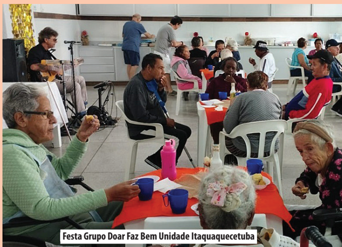
Festa Grupo Doar Faz Bem Unidade Itaquaquecetuba