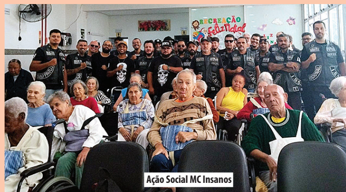
Ação Social MC Insanos

Em 24/01, o Grupo Doar Faz Bem realizou uma linda festa na unidade Penha, proporcionando momentos de alegria e integração aos residentes.