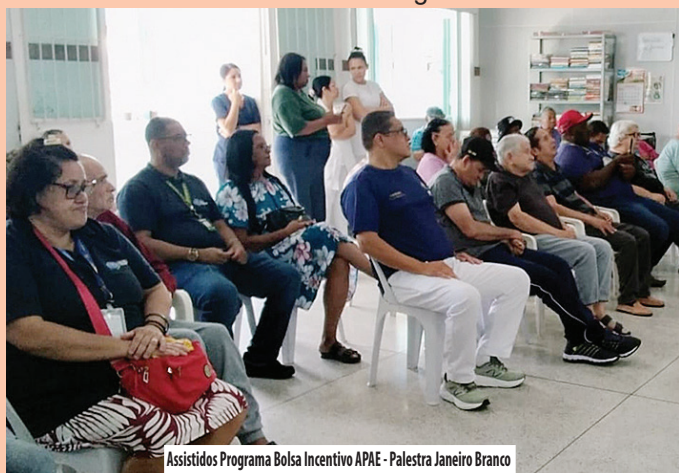
Assistidos Programa Bolsa Incentivo APAE - Palestra Janeiro Branco

O Motoclube Insanos realizou no dia 25/01, uma ação social na unidade Penha, proporcionando aos acolhidos um saboroso lanche da tarde, apresentação musical e muitos momentos de carinho e alegria.