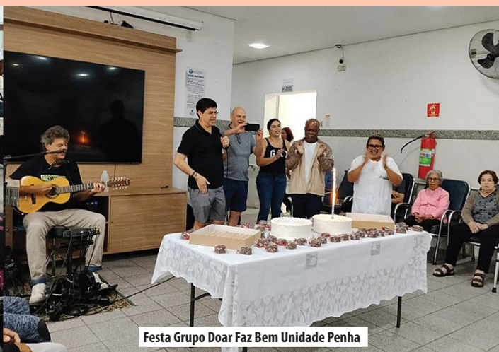
Festa Grupo Doar Faz Bem Unidade Penha

As ações de 2026 iniciaram-se na unidade Penha em 11/01, com a alegre visita dos Palhaços da ONG Presente de Alegria, que levaram leveza, sorrisos e momentos de descontração aos idosos acolhidos.