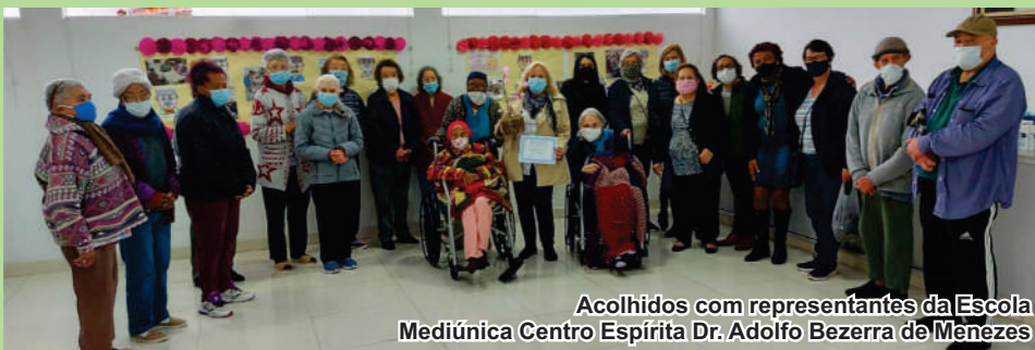
Acolhidos com representantes da Escola Mediúnica Centro Espírita Dr. Adolfo Bezerra de Menezes