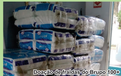
Doação de fraldas do Grupo 100+

nutrientes e vitaminas na alimentação diária, além é claro, de aumentar o prazer em comer sabendo que foram os mesmos que plantaram e realizaram a colheita. As atividades lúdicas permitem ao idoso estimular suas funções motoras, percepção, memória, criatividade, além de proporcionar aos mesmos momentos de