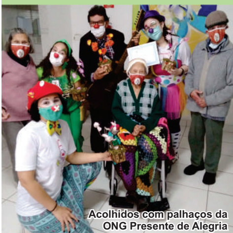
Acolhidos com palhaços da ONG Presente de Alegria

Unidas (ONU) em 1991, com o objetivo de sensibilizar a sociedade para as questões do envelhecimento e da necessidade de proteger e cuidar da população idosa. A Unidade de Itaquaquecetuba realizou uma comemoração para os idosos acolhidos "Um delicioso café da tarde" com comes e bebes escolhido pelos mesmos: Tarde do Havaí. Agradecemos a solidariedade e