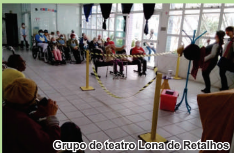
Grupo de teatro Lona de Retalhos